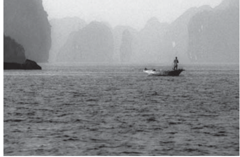
p. 61 / L'image du passeur.