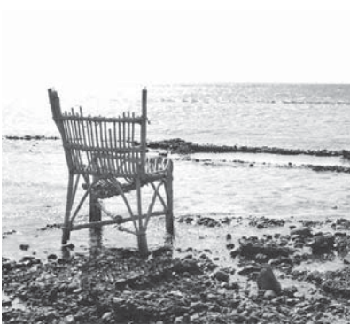
p. 87 / L'improvisation, une exploration de l'imaginaire.