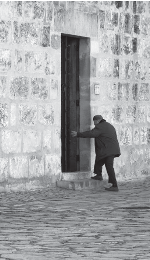
p. 46 / De l'autre côté.