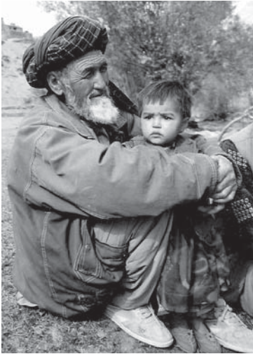
p. 83 / Une conteuse en Afghanistan.