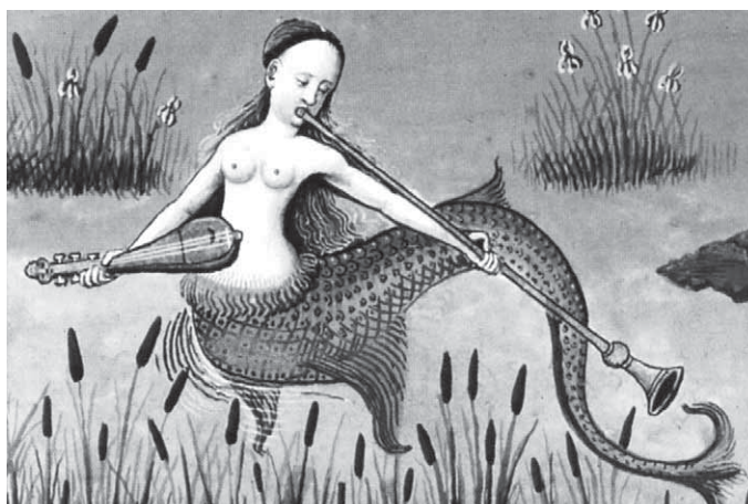
p. 32 / Sirènes : les chants de l'eau.