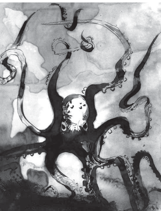
p. 21 / La pieuvre.