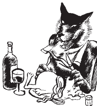
p. 61 / Cuisine des mots.