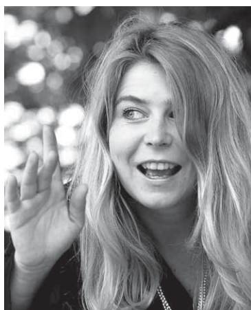
p. 78 / Une conteuse dans les étoiles.