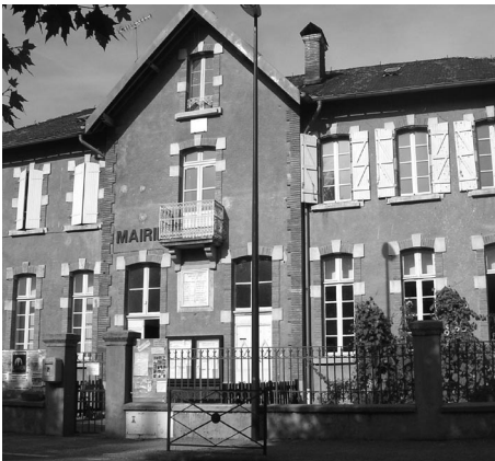
p. 76 / Quand l'école conte