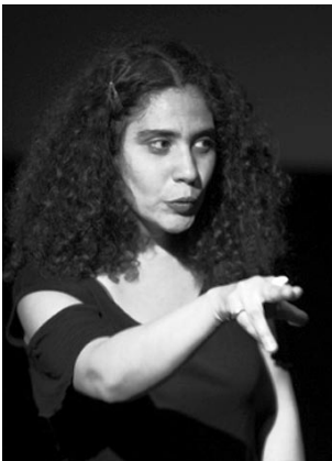
p. 85 / Les nuits de Chirine