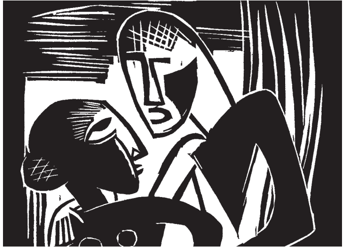
p. 16 / Mots de mise en garde