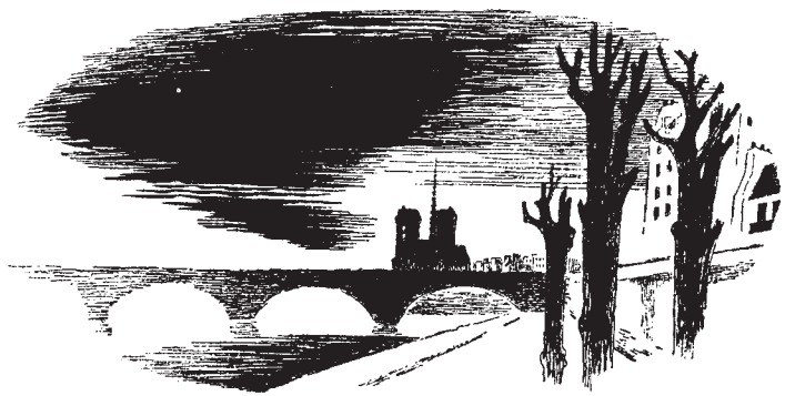
p. 66 / Une collecte dans le Paris des années 60