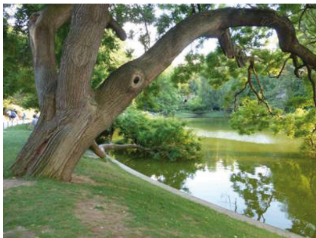
SOPHORA labellisé arbre remarquable. Le 25 novembre 2015

Avec le soutien des associations « vivre secrétan », « A.R.B.R.E.S », « Autour du Canal de l'Ourcq »